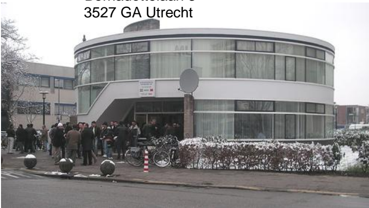
Eyüp Sultan moskee Bernadottelaan 3 3527 GA Utrecht