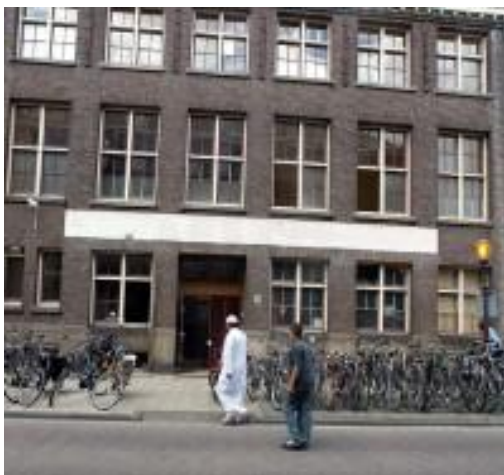
Stichting El Tawheed Jan Hanzenstraat 114 1053 SV Amsterdam www.eltawheed.nl